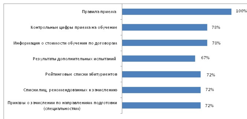
Рис. 1. Информация, отражающая ход приемной кампании в 2017г., представленная на официальных сайтах образовательных организаций высшего профессионального образования.

Информация, отражающая ход приемной кампании в 2017 году, представленная на официальных сайтах образовательных организаций высшего профессионального образования дана на рисунке 1.