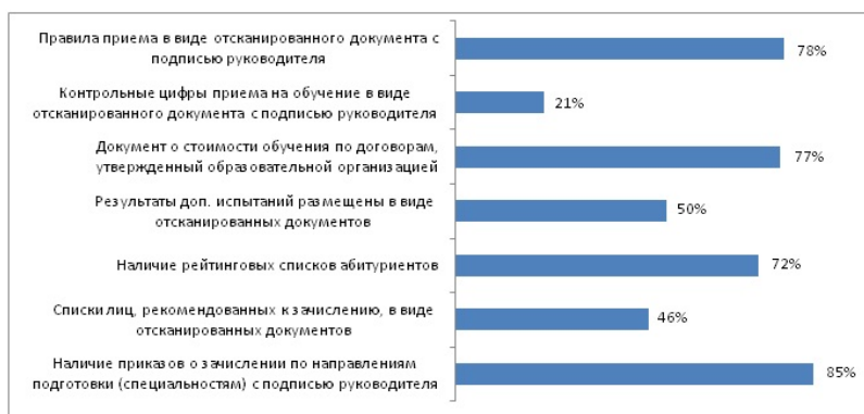
Рис.2. Соответствие информации на официальных сайтах образовательных организаций высшего профессионального образования приказу от 23.08.2016г. №.855 Министерства образования и науки

Соответствие информации, отражающей ход приемной кампании в 2017 году, представленной на официальных сайтах образовательных организаций высшего профессионального образования требованиям приказа от 23.08.2016г. №855 Министерства образования и науки представлено на рисунке 2.