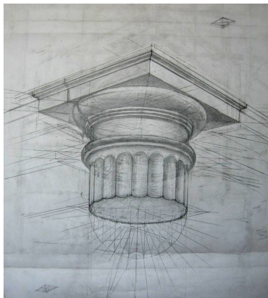
Рис. 1. Пример выполнения творческого задания « Рисунок »