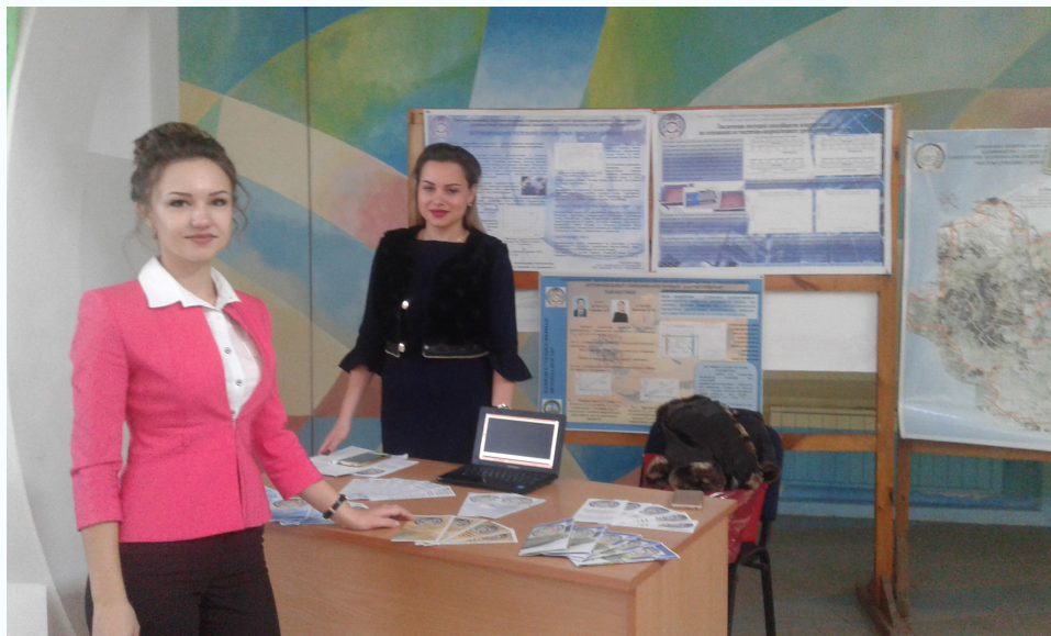
13. Инженерная геодезия: «Лазерный нивелир»; «Прибор контроля ВРС-93»; «Прибор контроля габарита проводов» – 3 плаката А1, опытный образец нивелира.