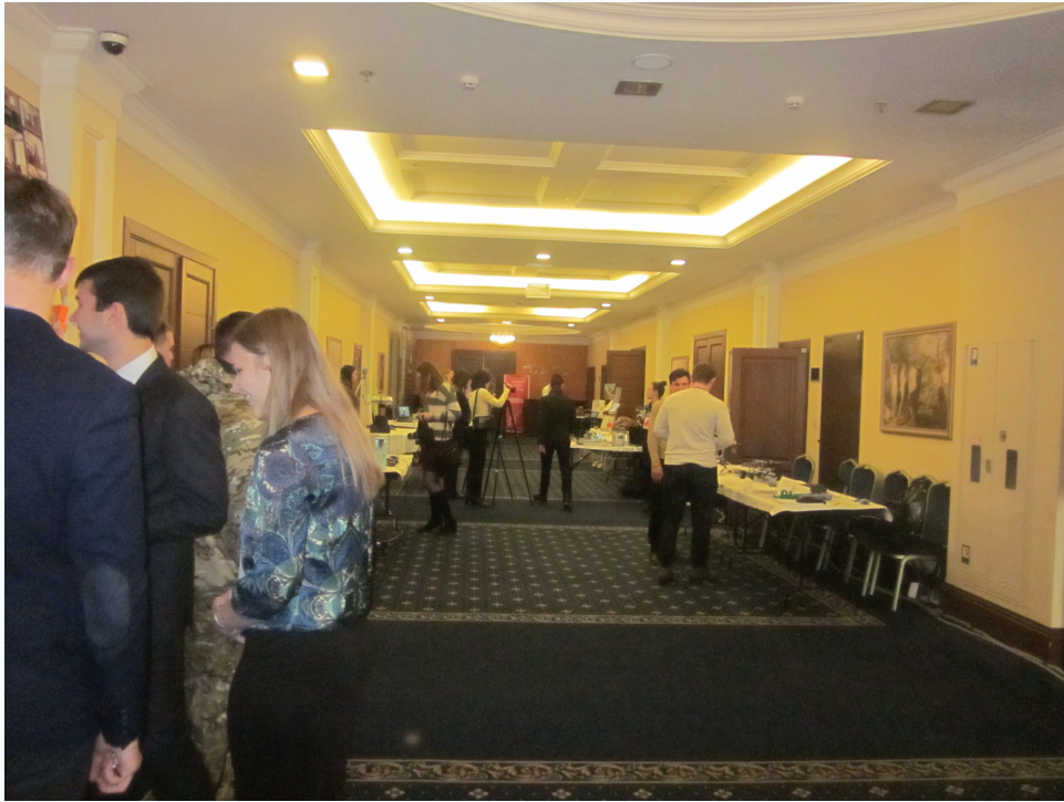
Работа фестиваля проходила по трем направлениям: движение, наука, творчество.