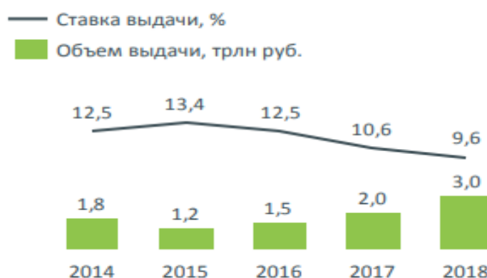
Рисунок 1.1 – Объем выданных ипотечных кредитов в Российской Федерации в 2014-2018 гг., трлн руб.

6.23. На все рисунки должны быть даны ссылки в тексте документа. При ссылках на рисунки в тексте выпускной квалификационной работе следует писать: «... в соответствии с рисунком 2.4».