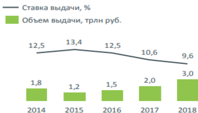
Рисунок 1.1 – Объем выданных ипотечных кредитов в Российской Федерации в 2014-2018 гг., трлн руб.

6.23. На все рисунки должны быть даны ссылки в тексте документа. При ссылках на рисунки в тексте выпускной квалификационной работе следует писать: «... в соответствии с рисунком 2.4».