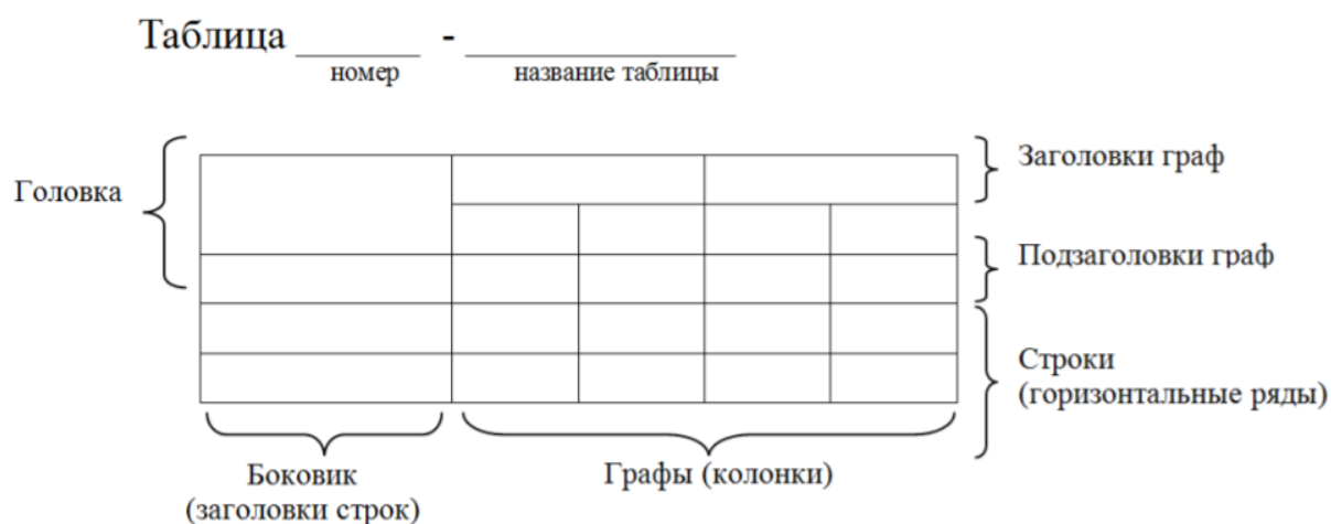
Рисунок 1 – Построение таблицы

6.4.5 Заголовки граф и строк таблицы следует оформлять с прописной буквы. Подзаголовки граф – со строчной буквы, если они составляют одно предложение с заголовком, или с прописной буквы, если они имеют самостоятельное значение. В конце заголовков и подзаголовков таблиц точки не ставятся. Заголовки и подзаголовки граф указываются в единственном числе. Слева, справа и снизу таблицы ограничиваются линиями. Разделение заголовков и подзаголовков боковика и граф диагональными линиями не допускается.