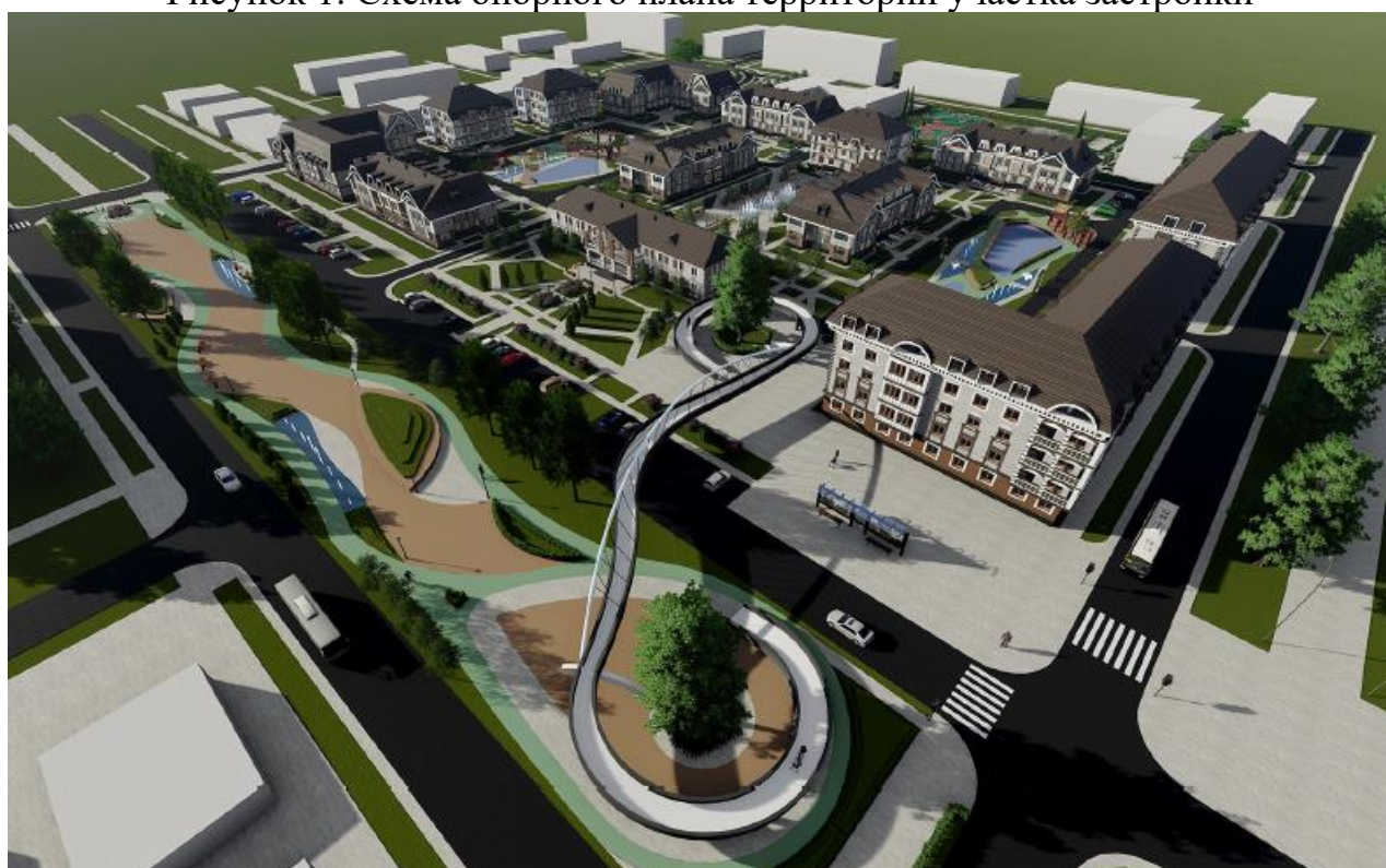
Рисунок 2. Объемно-пространственное решение участка реконструкции